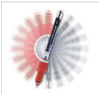
InPro 3100 (i) UD와 같이 업사이드-다운 설치 가능